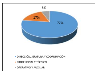
GRÁFICO Nº 1 ESTRATO DEL CARGO